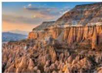
เมืองคัปปาโดเกีย

** พักที่ Dedeli Cave Hotel 5* หรือเทียบเท่า **