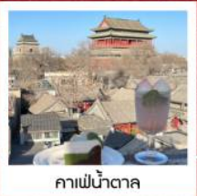
คาเฟ่ชาตาคา