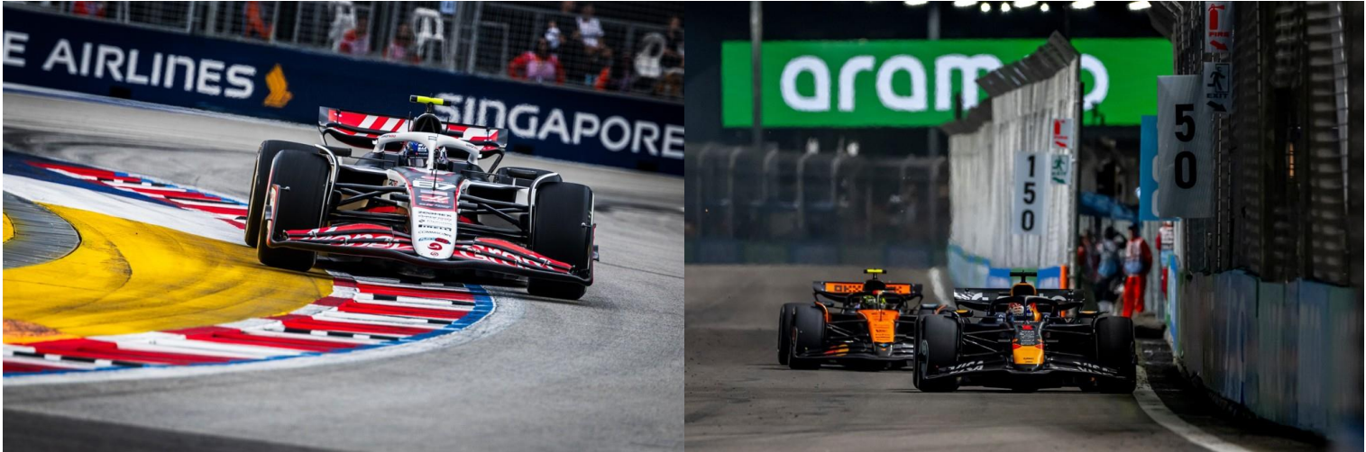
ชม รอบ SPRINT RACE + QUALIFYING

**เดินทางด้วยตนเอง เข้าร่วมงาน FORMULA 1 SINGAPORE GRAND PRIX 2026**