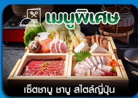
เซ็ตเมนู ซาซึ สีสต์ญี่ปุ่น