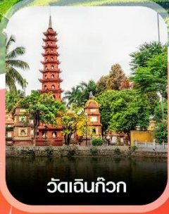
วัดเงินทิว

คอนเฟิร์ม ออกเดินทาง ทุกพีเรียด 2 ท่านขึ้นไป