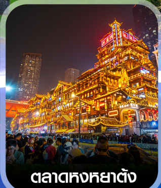
ตลาดหงหยาดต้ง