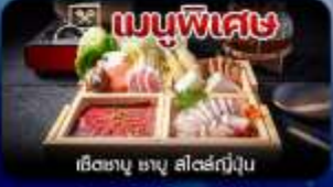
เมนูพิเศษ เซ็ตซาบู ซาบู สไตล์ญี่ปุ่น

โตเกียว-ฟูจิ-คามิโคจิ-ทะเลสาบคาวากูจิโกะ-หมู่บ้านน้ำใส-เมืองเก่าคาวาโกเอะ-คารุชิวาว่า-อีสะระซ้อบปี้งเต็มวัน