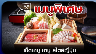
เมนูพิเศษ เซตซาซู ซาซู สีสัตสึมัน

โตเกียว-ฟูจิ-คามิโคจิ-ทะเลสาบคาวากุจิโกะ-หมู่บ้านน้ำใส-เมืองเก่าคาวาโกเอะ-คารุชิวาว่า-อีสะ ช้อปปิ้งเต็มวัน