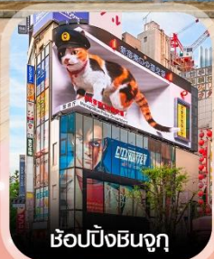
ซ้อปปิงชินจูกุ

✈️ คอนเฟิร์ม ออกเดินทาง ทุกพีเรียด 2 ท่านขึ้นไป