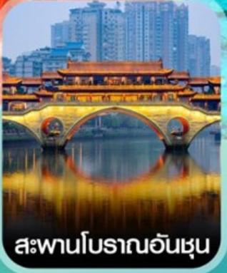
สะพานโบราณอันฮุน