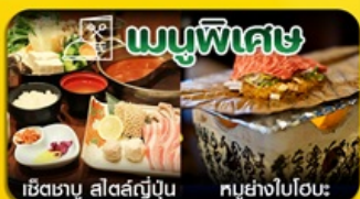
เช็ดเตบะ สดสัฎุบุน พูย่างไปโอะ