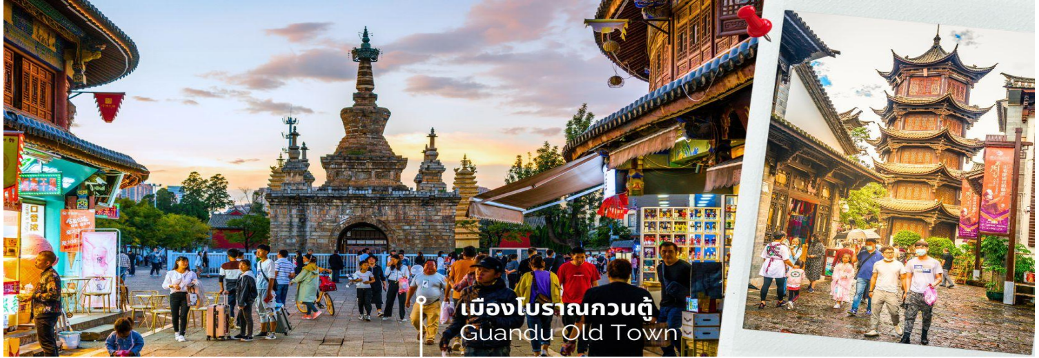
เมืองโบราณกวนตุ๋ Guandu Old Town

นำท่านชมบรรยากาศ เมืองโบราณกวนตุ๋ (Guandu Old Town) เป็นหนึ่งในต้นกำเนิดของวัฒนธรรมยูนนาน และยังเป็นหนึ่งในภูมิทัศน์ทางประวัติศาสตร์และวัฒนธรรม ที่สำคัญของเมืองคุนหมิง เมืองโบราณแห่งนี้ยังคงเป็นศูนย์กลางทางการค้าและคมนาคมที่สำคัญ ในอดีตเคยเป็นหมู่บ้านชาวประมงในสมัยราชวงศ์ถัง เมืองกวนตุ๋ยังเป็นเมืองแรกๆ ที่ศาสนาพุทธทางทิเบตได้เริ่มเผยแพร่เข้ามาในดินแดนยูนนาน