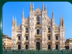
เซ็คคิน มหาวิหารดูโอโม มิลาน