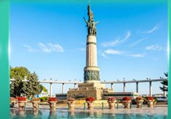
อนุสาวรีย์ฉิงหลง