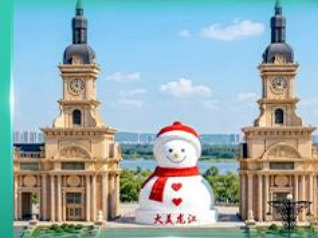
ตึกตาคิมะยักซ์ ฮาร์บิน