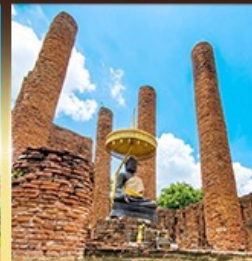
วัดธรรมิกราช