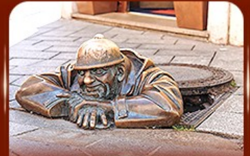
แลนด์มาร์คดัง รูปปั้นคูนิล Bratislava