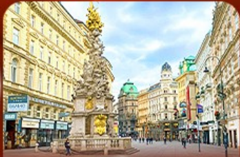
คาร์ทเนอร์ สตรีท ออสเตรีย