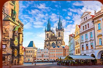
ชมย่านเมืองเก่า ปราท