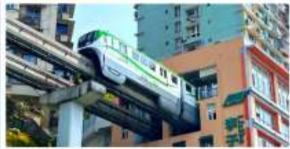
รถไฟฟ้าลัดтик