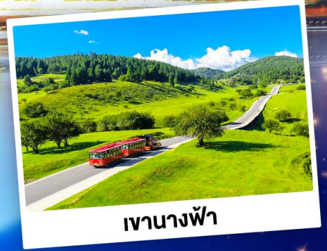
เจานางฟ้า