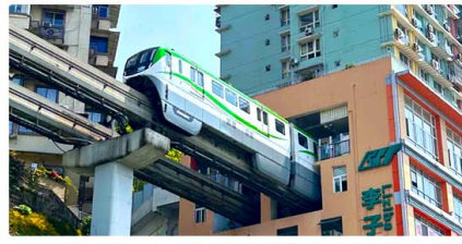
รถไฟฟ้าลัดดี