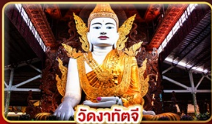
วัดงาทัจจี

สักการะ 3 มหาบูชาสถาน พักบนอินทร์แวน 1 คืน