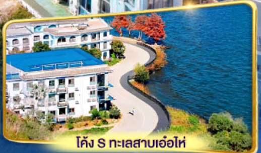
โค้ง S ทะเลสาบเอ๋อไห่