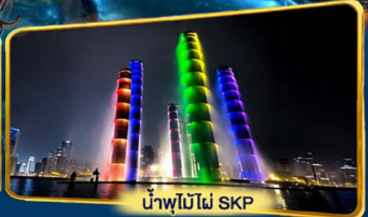
น้ำพุไม้ไผ่ SKP