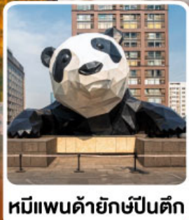
หมีแพนด้ายักษ์ป็นตึก