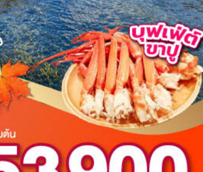
บุฟเฟ่ต์บายู

รวมจุดเช็คอินชมใบไม้เปลี่ยนสี โอซาก้า ชิซุโอะกะ ฟูจิ โตเกียว