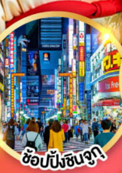
ช้อปปิ้งชุนจูกา