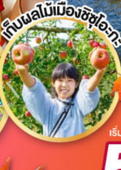
เก็บผลไม้เมืองชิซุโอะกะ