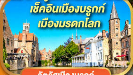
จัตุรัสเมืองบรูกก์