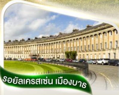
รอยัลคราสซัน เมืองบาร