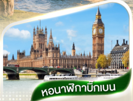
หอนาฬิกาบิ๊กเบน