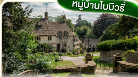
หมู่บ้านโบนิวรี่