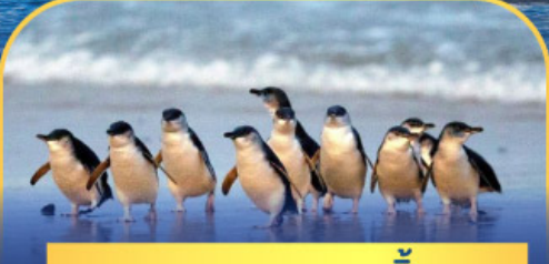
พาหรดนกกเพนกวิน