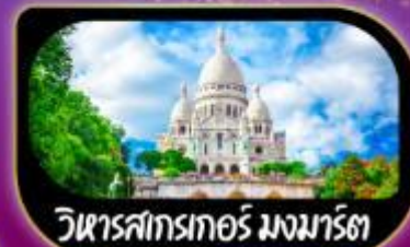
วิหารสกรทอร์ มงมาร์ต