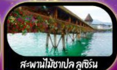
สะพานไม้ชาเปล ลูซิร์น