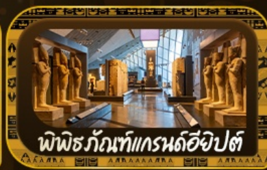
พีพีทริกันท์แกรนด์อียิปต์