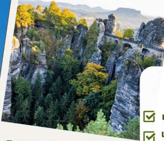
สะพานบาสไต (Bastei Bridge)