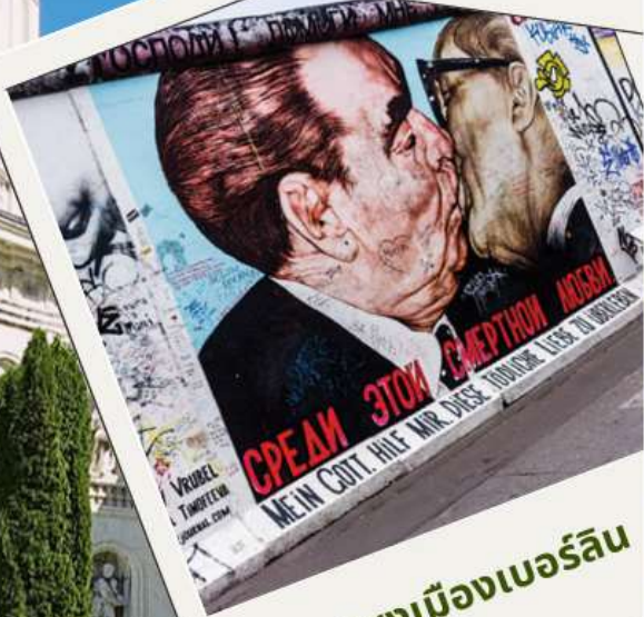
กำแพงเมืองเบอร์ลิน