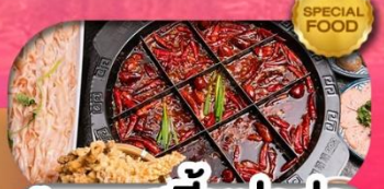
มือพิเศษ สุกี้หม่าล่า