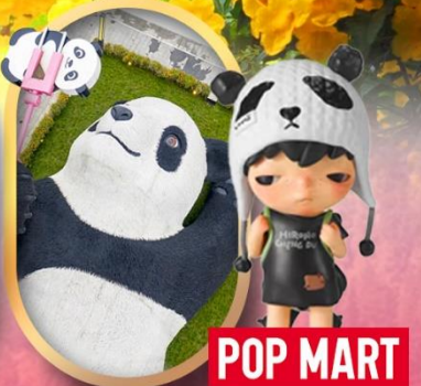
POP MART หมีแพนด้าเซลฟ์