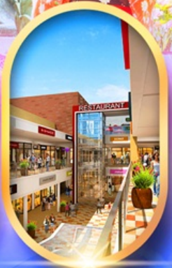
มิตซุซุเอะอิเกะอิ