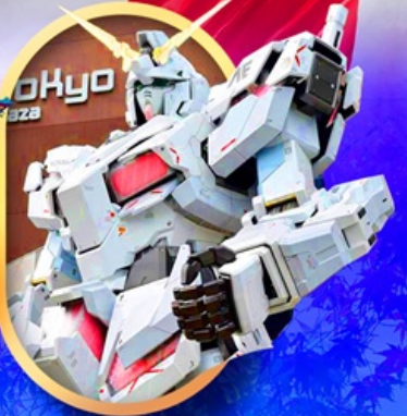
ห้างไอโดะบะกันดัม