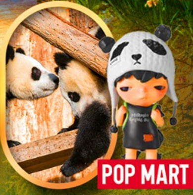
ศูนย์อนุรักษ์หมีแพนด้า POP MART

เจิ้งตู ปี้ผิงโกว จิ้งจ้ายโกว หมีแพนด้าตัวเป็นๆ