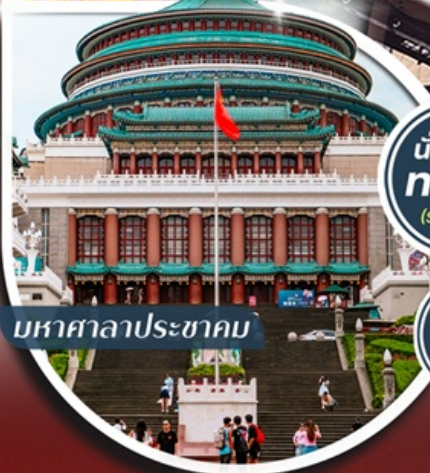
มหาศาลาประชาชน