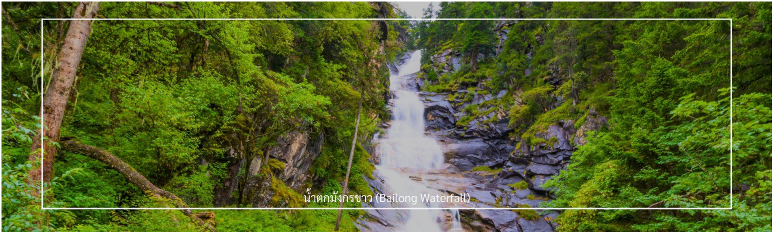
น้ำตกมังกรขาว (Bailong Waterfall)

น้ำตกมังกรขาวมีความสูงและแรงน้ำที่ไหลลงอย่างสวยงาม ตกจากหน้าผาสูงสู่น้ำด้านล่างด้วยความสูงกว่า 100 เมตร มองไกลๆ ดูคล้ายมังกรสีขาวที่กำลังเลื้อย มีน้ำที่ใสสะอาดสามารถมองเห็นการไหลของน้ำตกได้อย่างชัดเจน บริเวณรอบๆ น้ำตกมีภูเขาและต้นไม้เขียวขจี ทำให้ทิวทัศน์โดยรอบน่าตื่นตาตื่นใจ เหมาะสำหรับถ่ายภาพและการเดินเล่น