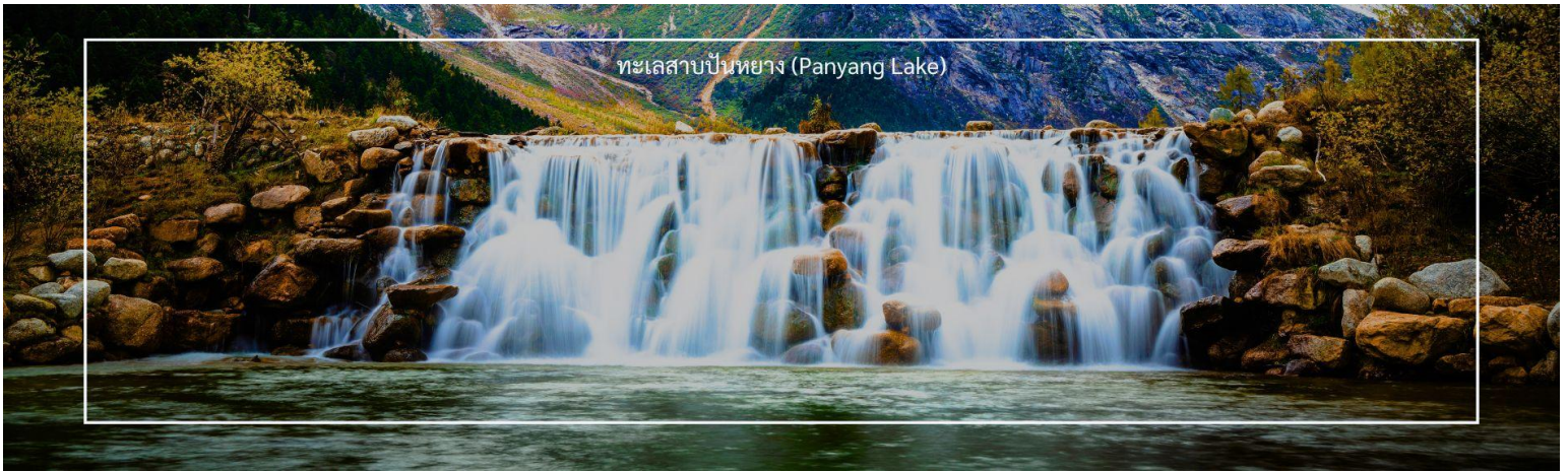
ทะเลสาบป๋นหยาง (Panyang Lake)