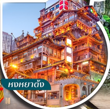
หงหยาดั่ง