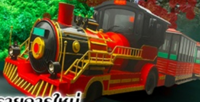
รายการใหม่

รวมภาษีน้ำมันเชื้อเพลิง และภาษีสนามบินแล้ว