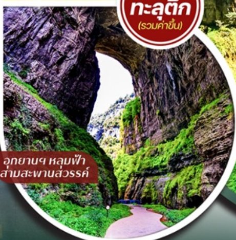
อุทยานฯ หลุมฟ้า สามสะพานสวรรค์