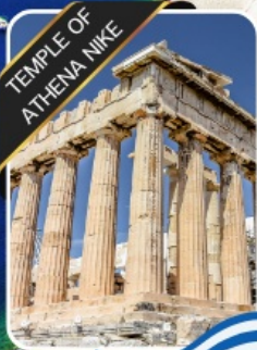
TEMPLE OF ATHENA NIKE