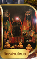
วัดหน้ามัว