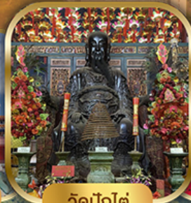
วัดปึกใต้