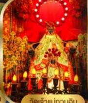
เจ้าแม่กวนอิม ฮ่องกง