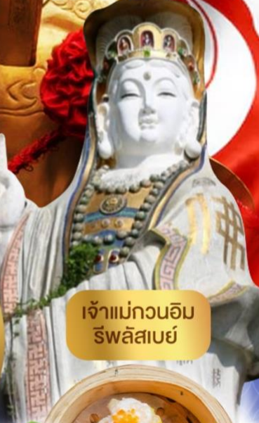
เจ้าแม่กวนอิม ริฟลิสเบย์