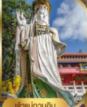
เจ้าแม่กวนอิม ริฟลิสเบย์