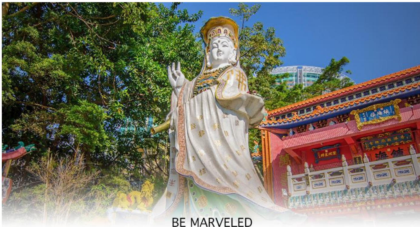
BE MARVELED วัดเจ้าแม่กวนอิมริปลัสเบย์

จากนั้นนำท่านเดินทางสู่ วัดหลินฟ้า (LIN FA KUNG TEMPLE) วัดหลินฟ้ากอยู่ในย่านหว่านไจ้ ตั้งอยู่บนเนินเขาหันหน้าออกสู่ทะเลทางทิศตะวันออกเฉียงใต้ของอ่าวคอสเวย์ ถึงแม้จะเป็นวัดเล็ก ๆ แต่วัดหลินฟ้า คือวัดเก่าแก่ที่มีประวัติความเป็นมาเกี่ยวข้องกับความศักดิ์สิทธิ์ของเจ้าแม่กวนอิมโดยตรงวัดนี้ตั้งอยู่บนถนนลิลี สตรีท (Lily St.) ที่เชื่อมต่อกับถนน Lin Fa Kung ตามชื่อวัดหลินฟ้า ตำนานเล่าว่า ในสมัยราชวงศ์ซิง เจ้าแม่กวนอิม หรือพระโพธิสัตว์กวนอิม ซึ่งเป็นเทพีแห่งความเมตตา ได้ปรากฏกายขึ้นบนโขดหินรูปดอกบัว (Lotus Rock) ณ บริเวณที่ตั้งของวัดในปัจจุบัน ชาวบ้านเชื่อว่าการปรากฏกายของเจ้าแม่กวนอิมเป็นสัญลักษณ์ของความโชคดีและการคุ้มครองจากภัยพิบัติต่างๆ จากจุดนี้ เราสามารถเดินเล่นเดินเที่ยว ต่อไปยังถนนเส้นอื่น ๆ ได้ง่าย ตลอดเส้นทาง ทำให้วัดหลินฟ้า หรือ หลินฟ้ากง (Lin Fa Kung) แห่งนี้ อยู่ในจุดที่นักท่องเที่ยวสามารถเข้ามาไหว้ขอพรเจ้าแม่กวนอิมวังดอกบัวได้สะดวก