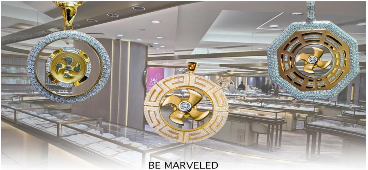
BE MARVELED ศูนย์ฮวงจุ้ย กั๋วหิ้นเศรชชี่

ว่าหยก มงคล ถ้าพกติดตัวไว้จะอายุยืนและสุขภาพดีมีสินค้ามากมายเกี่ยวกับหยก อาทิ กำไลหยก หรือสัตว์นำโชคอย่างปี่เซ่ยะ ให้ ท่านได้เลือกซื้อเป็นของฝาก, ของที่ระลึก หรือของนำโชคแต่ตัวท่านเอง