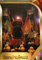
วัดบ้านใหม่