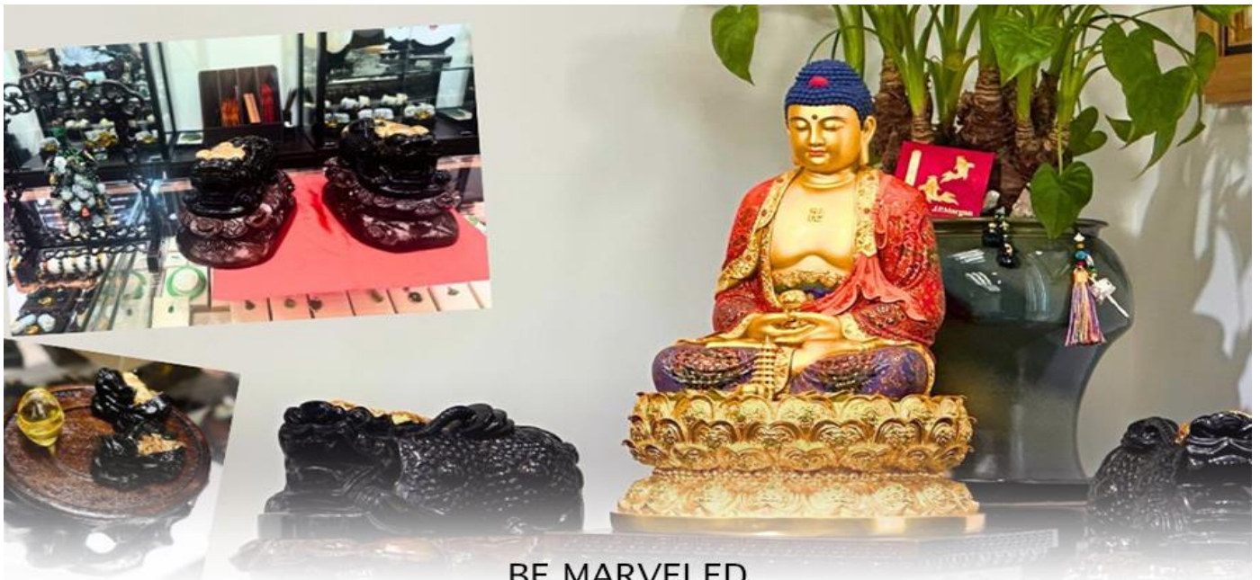
BE MARVELED ศูนย์ปี่เซ่ยะ