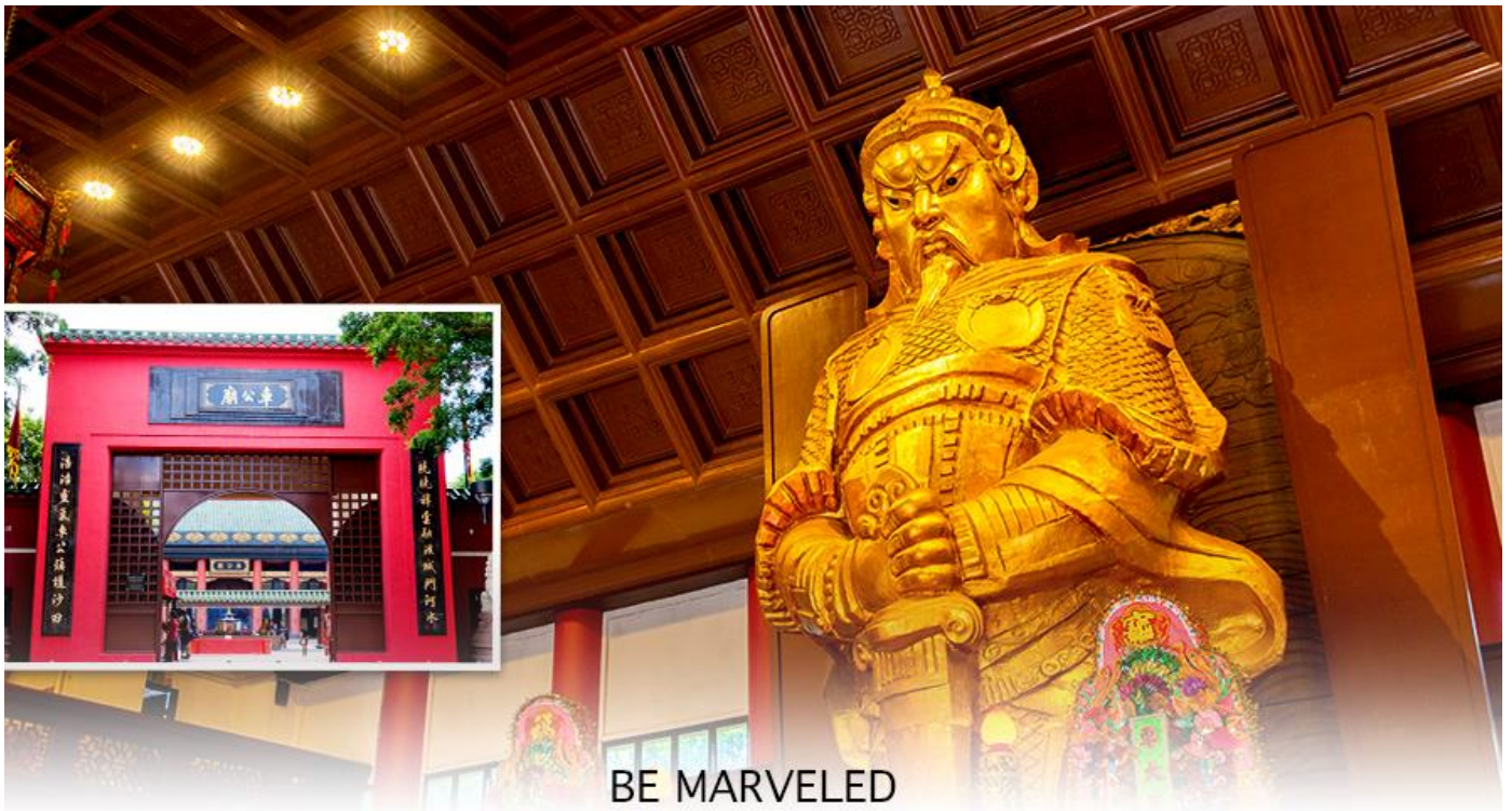
BE MARVELED วัดแชกง

นำท่านเดินทางสู่ วัดแชกงหมิว หรืออีกชื่อหนึ่งว่า “วัดกังหันลม” โดยมีสัญลักษณ์เป็นกังหันนำโชค สร้างขึ้น เพื่อรำลึกถึงท่านแชกงองค์เก่าแก่ มีอายุกว่า 300 ปี ตั้งอยู่ในเขต SHATIN ให้ท่านได้จุ้รูปขอพร สักการะ เทพเจ้า แชกง เป็นอีกหนึ่งวัดที่มีประวัติศาสตร์อันยาวนาน มีตามตำนานเล่ากันว่าได้มีโจรสลัดต้องการที่จะมาปล้นชาวบ้าน เมื่อนายพลแชงรู้เข้าก็ได้บอกให้ชาวบ้านปักกังหันลมแล้วนำไปติดไว้ที่หน้าบ้าน ปรากฏว่าโจรสลัดได้จากไปและไม่ได้ ทำการปล้น ชาวบ้านจึงมีความเชื่อวังกังหันลมนั้นช่วยจัดสิ่งชั่วร้ายที่กำลังจะเข้ามา และนำพาสิ่งดีๆ มาสู่ตน จึงได้ สร้างวัดแชกงแห่งนี้ขึ้น เพื่อระลึกถึงนายพลแชกง และเป็นที่พักกระบุงหาเพื่อไม่ให้มีสิ่งไม่ดีเกิดขึ้น โดยจะมีวิธีการไหว้ คือ ตั้งจิตอธิษฐานด้านหน้าองค์เจ้าพ่อแชกง จากนั้นให้ท่านหมุนกังหัน จะมีกังหัน 4 ใบพัด แต่ละใบหมายถึงพร 4 ประการ คือ เดินทางปลอดภัย, สุขภาพแข็งแรง, สมความปรารถนา, และ โชคลาภเงินทอง เชื่อกันว่าหากหมุนครบ 3 รอบและตีกลอง 3 ครั้ง ถือว่าเป็นการช่วยหมุนปัดเป่าเอาสิ่งร้ายและไม่ดีออกไปให้หมด และนำพาสิ่งดีๆ เข้ามาแทน