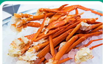
พิเศษ! บุฟเฟ่ต์จางู