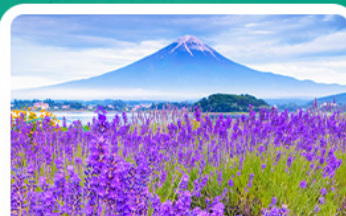
สวนโออิชิพาร์ค