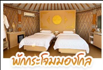
พักกระท่อมมองโกล