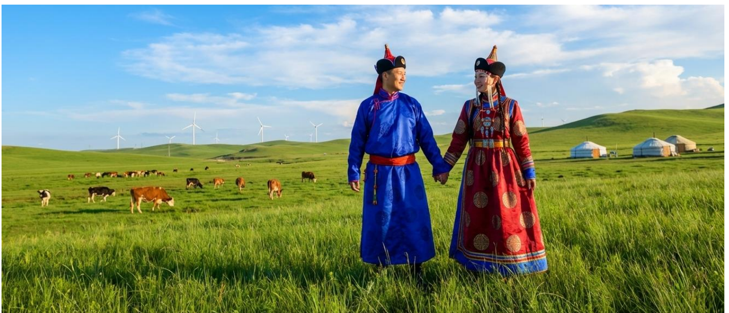
บ่าย นำท่านเข้าร่วมกิจกรรม สวมชุดแบบมองไกล สัมผัสพลังแห่งบรรพบุรุษ สวมเสื้อคลุมแบบดั้งเดิมที่มีสีสันสดใส ปักลวดลายอันประณีต คุณจะสัมผัสได้ถึงพลังแห่งบรรพบุรุษที่เคยปกครองดินแดนครึ่งโลก การสวม