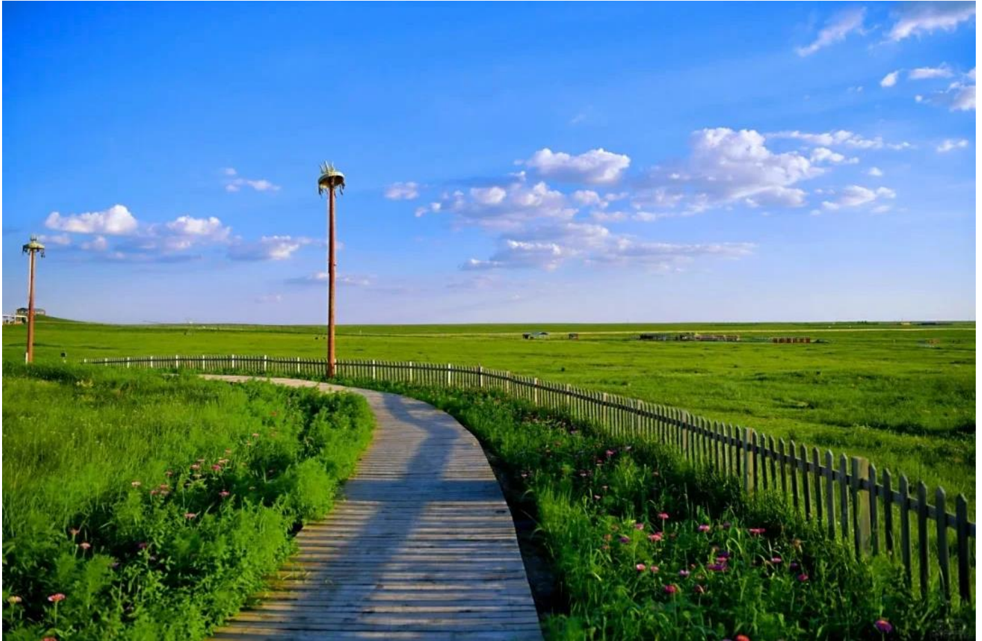
กลางวัน รับประทานอาหารกลางวัน ณ ภัตตาคาร (มือที่ 2)

ตั้งอยู่ท่ามกลางเนินเขาลูกคลื่นที่เป็นไปหลายสิบล้านไร่ รวากับผืนผ้าเขียวขจีที่ไม่มีที่สิ้นสุด การจัดวางเต็นท์มองไกล 399 หลังรอบๆ เต็นท์ทองคำหลวง 2 หลัง สร้างผังแบบ "นกอินทรีกางปีก" ที่สวยงามและสมมาตร ภูมิอากาศที่แห้งแล้งสร้างท้องฟ้าใสราวกับใบหน้าของเทพเจ้า ทำให้ทุกช่วงเวลาที่นี่เต็มไปด้วยแสงแดดอันอบอุ่นและลมเซาๆ ที่พัดผ่านใบหญ้าอย่างอ่อนโยน กิจกรรมต่างๆ ที่นี้จะทำให้ท่านได้สัมผัสทั้งความตื่นเต้นและความสงบ