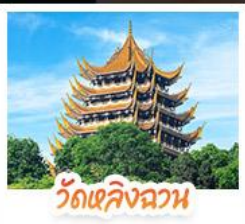
วัดเลิ่งอว่น