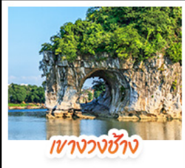
เขาวงวงช้าง