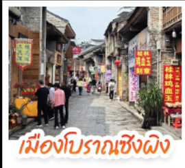
เมืองโบราณชิงผิง

เช็คอินจุดไฮไลท์โลกทัยหลิน เจดีย์เงินเจดีย์ทอง เขาวงวงช้าง นั่งเคเบิลคาร์สู่ เขาหรือ จุดชมวิวกะหลกเขา แห่งเมืองหยางซัว ล่องเรือแม่น้ำลู่เจียง ตามรอยช้างหลังกาพรนบัตร 20 หยวน อิสระช้อปปิ้งถนนคนเดิน 2 แห่ง ถนนตงซีเซียง ถนนซีเซียง นั่งกระเช้าบอลูนชมวิวแบบ 360 องศา