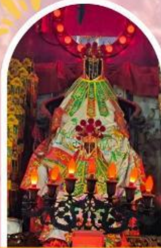
วัดเจ้าแม่กวนอิมฮ่องกง ขอพรเรื่องเงิน ทรัพย์สิน และความมั่งคั่ง