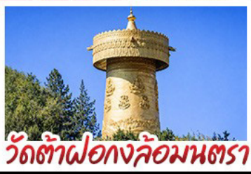
วัดต้าเฟอ กงล้อมนตรา