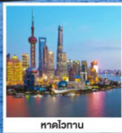
หาดโวกาน