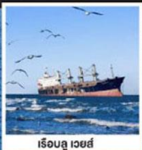
เรือลู เวย์ส์