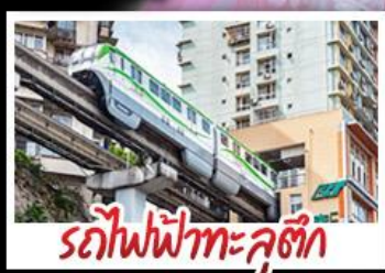
รถไฟฟ้าทะเลสาบ