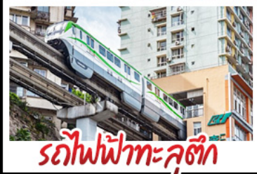
รถไฟฟ้าทะลุติ๊ก