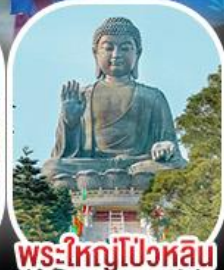
พระใหญ่โป่วหลิน