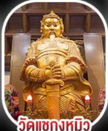
วัดเข่งหมิว