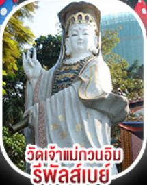
วัดเจ้าแม่กวนอิม รีพัลส์เบย์