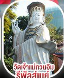
วัดเจ้าแม่กวนอิม รีพัลส์เบย์