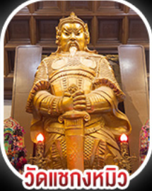
วัดเข่งหมิว