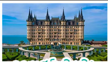
คุกาสัมหลวมอิง

เมืองเก่าซิงคโปร์ - คุกาสัมหลวมอิง เบียร์ซิงคโปร์ + อาหารทะเล สตรีทอาร์ต สตูดิโอจิบลิ