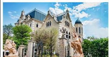
NINA CHOCOLATE CASTLE

ทะเลสาบสุริยจันทราร - ไทเป 101 จิวเฟิน - NINA CHOCOLATE CASTLE MONSTER VILLAGE - ซีเหมินติง เมนูพิเศษ ปลาประจานาธิบดี เซี่ยวหลงเปา / ซาบูไต้หวั่น