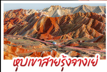
หุบเขาสายรุ้งจางเย่