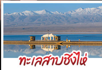
ทะเลสาบซิงไห่