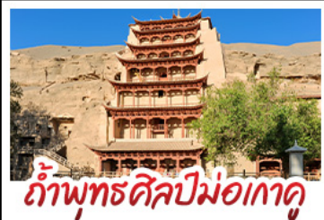
กำแพงศิลปะม่อเถา

มินิพระราชวัง - สระน้ำงพระจันทร์ ทะเลสาบเกลือฉางซ่า - กำแพงศิลปะม่อเถา หุบเขาสายรุ้งจางเย่ - ทะเลสาบซิงไห่