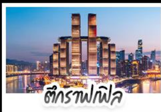
ตึกรางฟไฟล